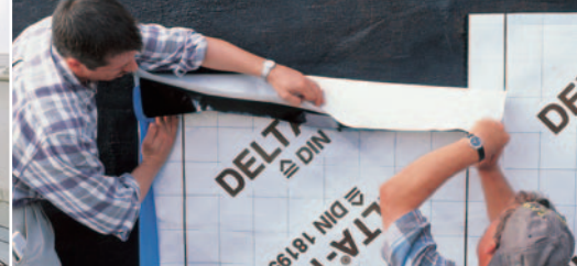
Pincefalak megbízható védelme.