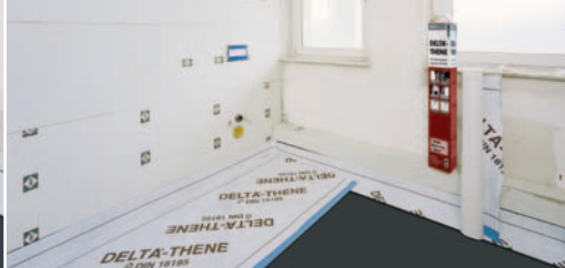
Biztonságos szigetelés a nedves helyiségekben.