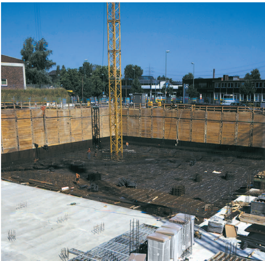
DELTA®-TERRAXX – komplett egységként, egy munkafolyamatban fektethető.