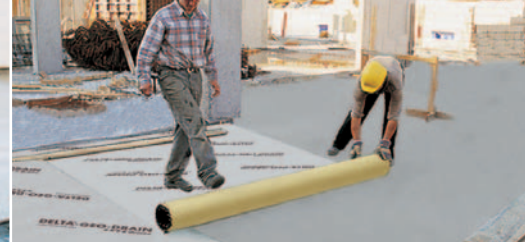
A drénezendő felület lejtése 2 - 3 %.